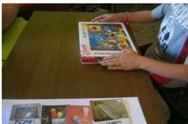
Tabella delle scelte