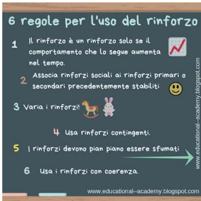
6 regole per un buon uso del rinforzo

Il rinforzo è un principio importante che determina un effettivo cambiamento nel comportamento. Lo si utilizza in tutti programmi ABA ma è anche qualcosa che accade naturalmente, nella tua vita di tutti i giorni. Fermati a pensare alle tue giornate e alla tua vita: ti renderai conto che quasi tutto è mosso dal principio del rinforzo e che ogni nostro comportamento è incoraggiato o meno dalla risposta che otteniamo quando lo emettiamo.