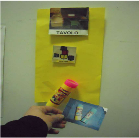
Comprensione delle proposte